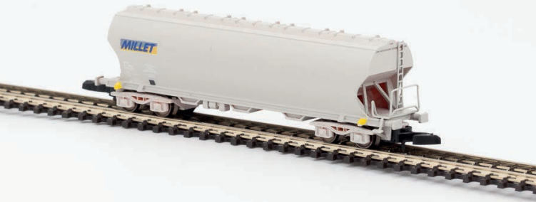
W01-MI1 Wagon céréalier MILLET - époque V-VI

NOUVEAU : Les attelages sont en version courte pour un espacement entre les wagons réaliste.