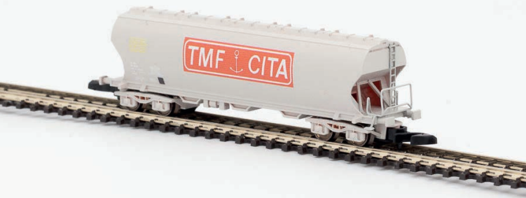
W01-TR1 Wagon céréalier TMF CITA rouge - époque IV-V