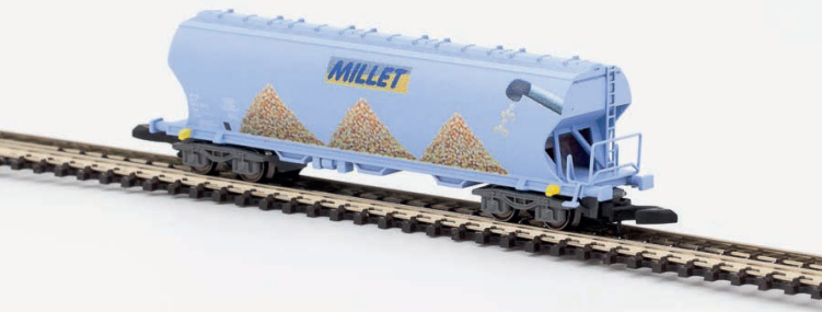
W01-MM1 Wagon céréalier bleu MILLET Maïs - époque VI