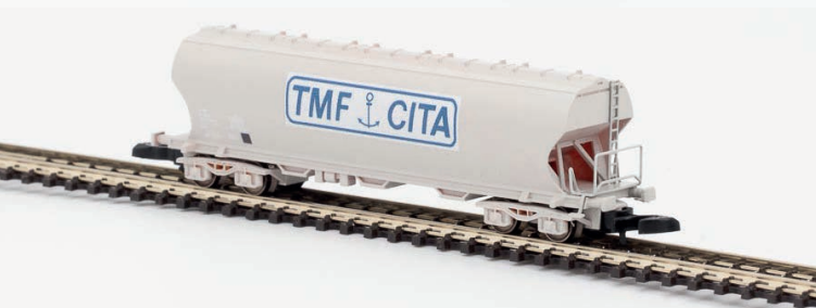
W01-TB1 Wagon céréalier TMF CITA bleu - époque IV-V